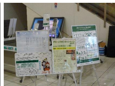
ポスター掲示風景