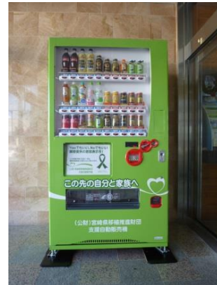
自動販売機（川南町）

今後とも、啓発や財団の収入確保の一つとして設置を進めてまいりますので、病院や施設などで新たに設置できるところがありましたら御連絡をよろしくお願いいたします。