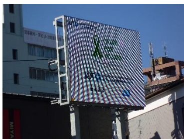
デジタルサイネージ