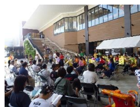
グリーンライトアップ