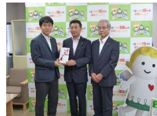
寄附金贈呈式（三桜電工）