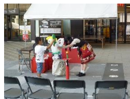
街頭キャンペーン