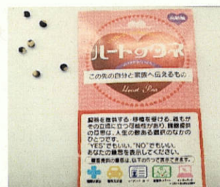
（グリーンリボンドライバーステッカー）