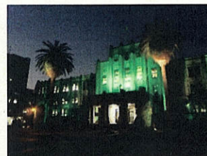
(グリーンライトアップ)