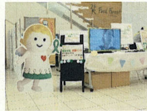
(グリーンリボンキャンペーン)