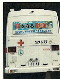
(グリーンリボンドライバーステッカー)