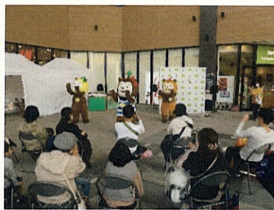
(バルーンパフォーマンス・みやざき犬のダンスショー)