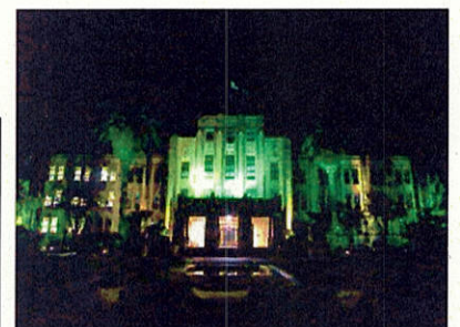
(県庁本館のライトアップ)

10月16日に毎年行われる全国グリーンライトアッププロジェクトに参加するため、今年は、10月11日から17日まで、宮崎県庁のグリーンライトアップを実施いたしました。橘並木の中に、グリーンに染まる宮崎県庁本館は幻想的で皆さんの目を引いたことと思います。