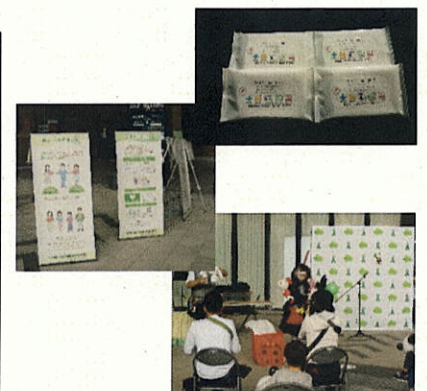
(ウェットティッシュ・啓発バナー)

また、ふるさと愛の基金の助成では、啓発バナーやグリーンリボンバックパネルを作成しました。早速イオンモール宮崎のキャンペーンに設置し、啓発に一役買っていただきました。今後とも活用していくこととしています。