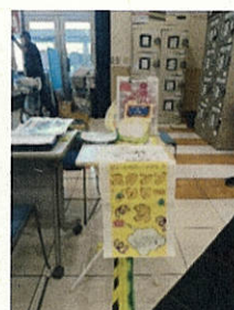
(スタンプラリー・ガチャガチャ)