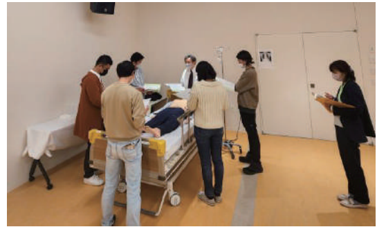
<法的脳死判定体験型セミナー>